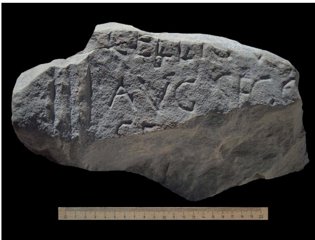
Fig. 1. Fotografía del epígrafe (Cebrián, 2020: 169, fig.1).