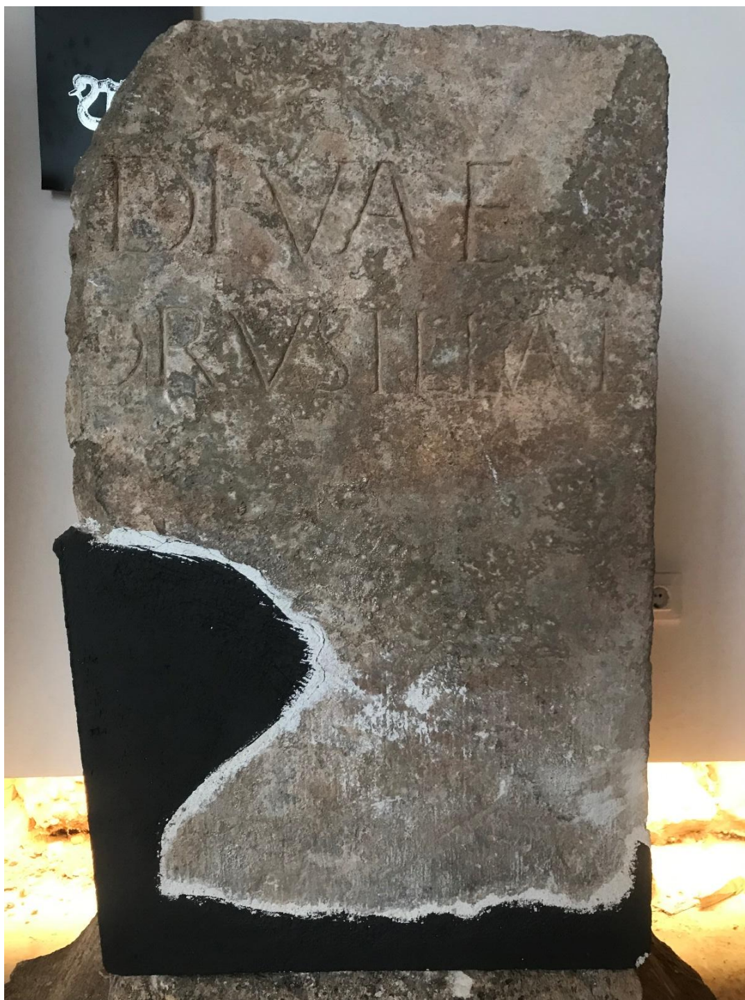
Fig. 2. Neto del pedestal.