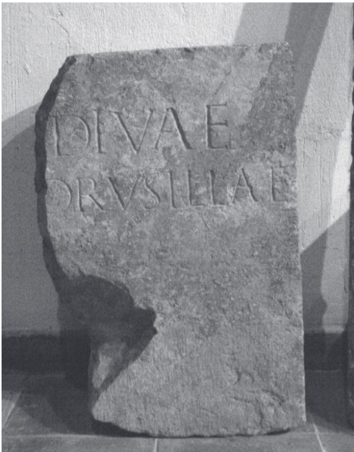
Fig. 3. La inscripción antes de su consolidación (Gozalbes, 2009: 196).