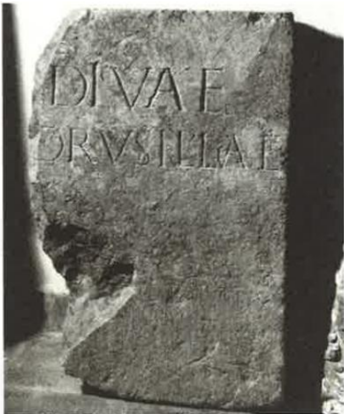
Fig. 4. Primera fotografía publicada ( CIL II/13, 971).