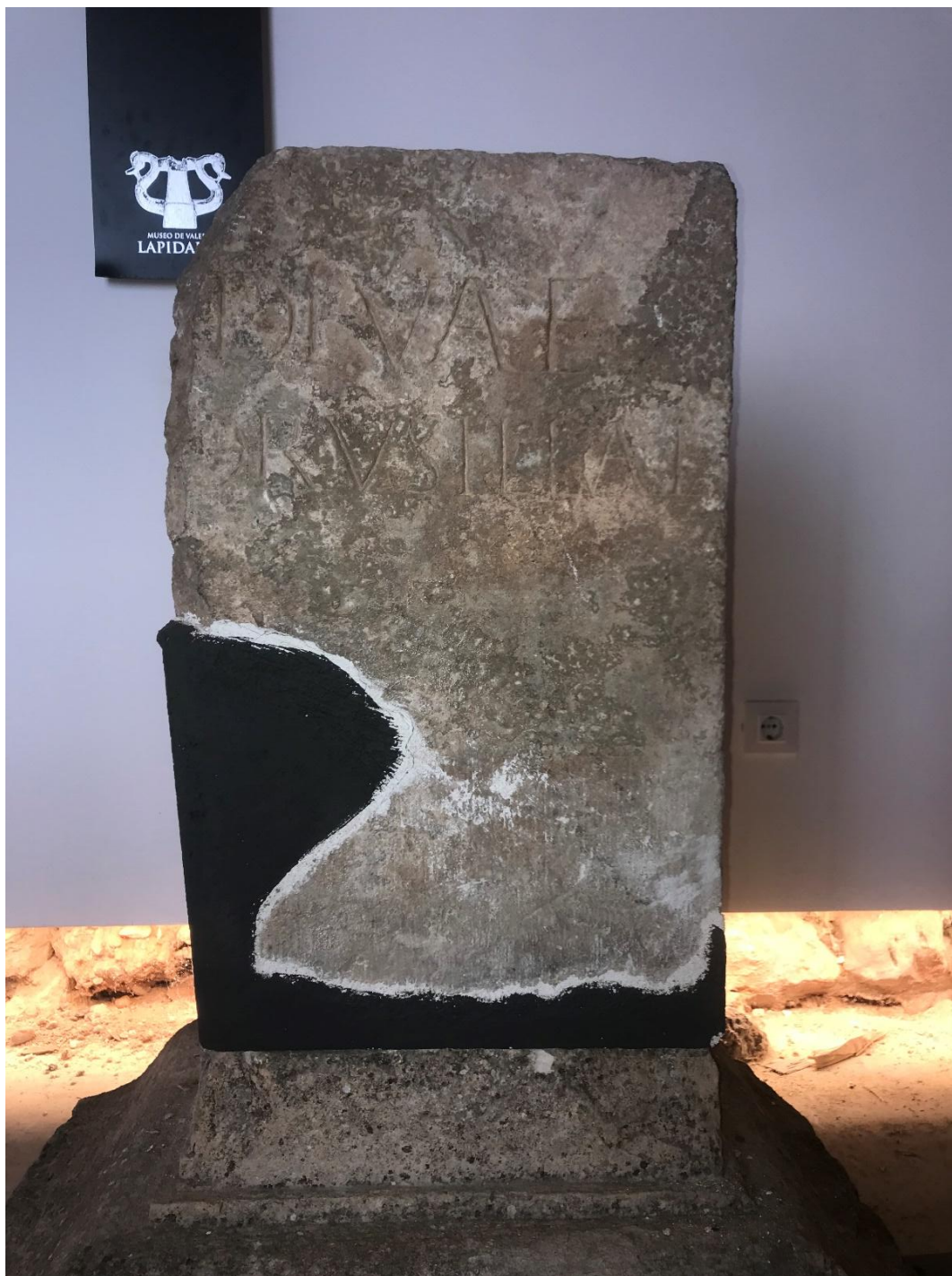
Fig. 1. Conjunto de base y neto.