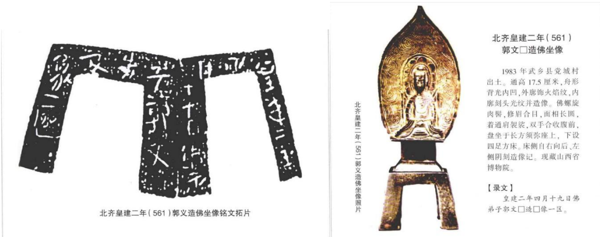
Nº1 皇建二年/四月/十九日佛弟子郭文造像一區