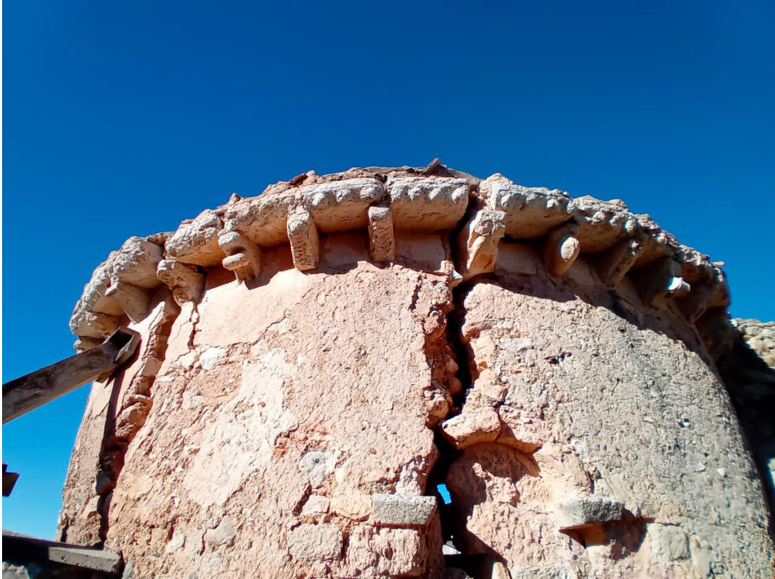
Fig. 1. Vista parcial del ábside con la ventana y los cimacios.

Parece que la edificación del templo corresponde al siglo XII, aunque no existe acuerdo entre los investigadores sobre su fecha concreta de construcción. Gaya Nuño (1946: 60) asevera que no ha de ser posterior a los años iniciales del siglo XII, mientras que Ortego (1985: 33) y la Enciclopedia del Románico 5 la sitúan más hacia la segunda mitad del siglo.