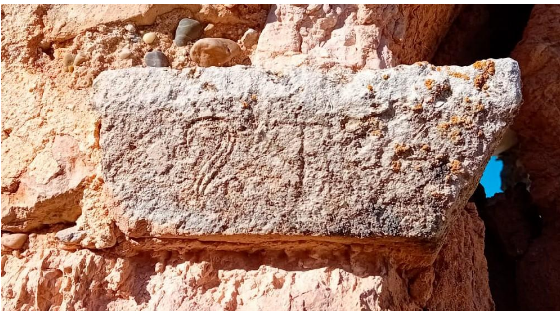
Fig. 3. Cimacio de la izquierda (cara frontal).