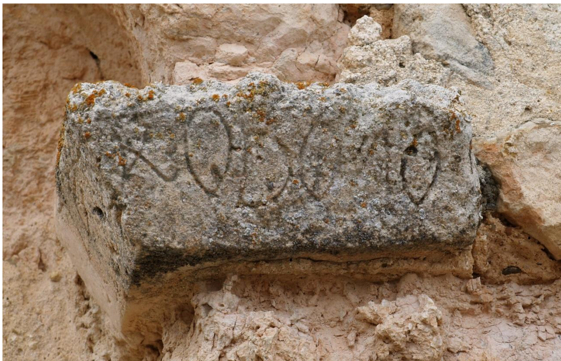
Figura 6. Cimacio de la derecha (cara frontal).

Son escasas las inscripciones sorianas al norte del Duero. Únicamente se conserva una adscrita al siglo XI y otras once que se sitúan con seguridad en el siglo XII (Paniagua Fairén, 2013). Esta parquedad de epígrafes, por un lado realza la importancia de las que aquí presentamos, pero por otro dificulta su labor de estudio, tanto gráfico como de contenido, al ser más escasas las posibilidades de comparación con otros ejemplares.