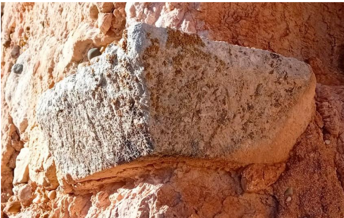
Fig. 2. Vista del cimacio de la izquierda.