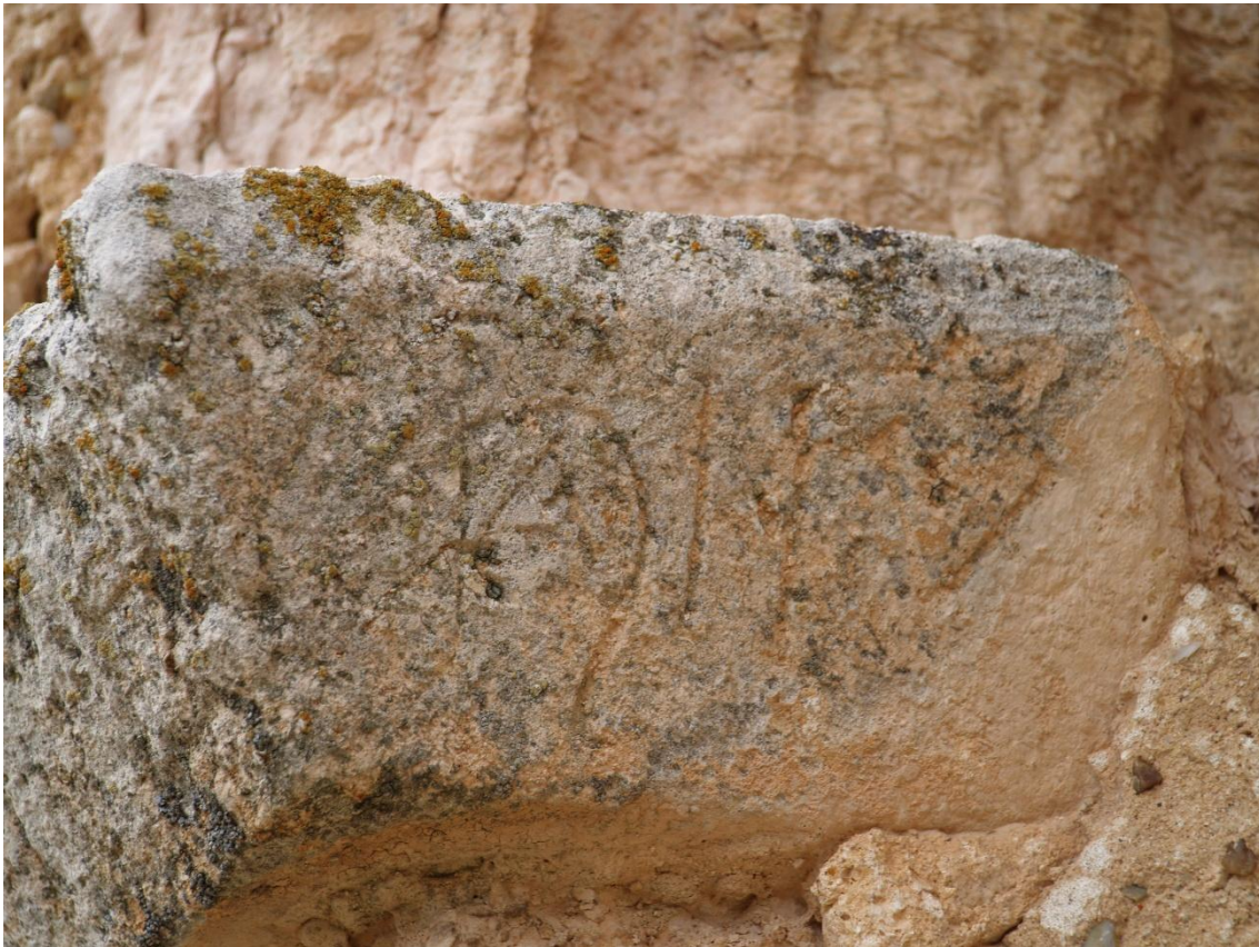
Fig. 4. Cimacio de la izquierda (cara interna).