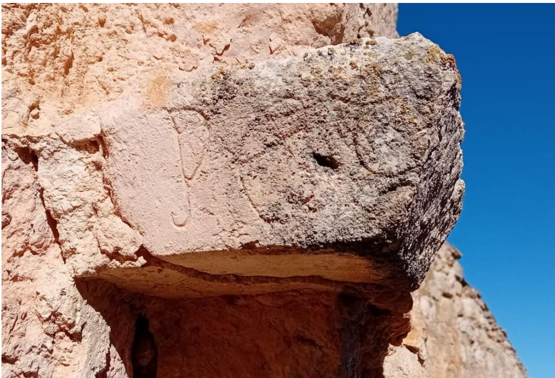
Figura 5. Cimacio de la derecha (cara interna).