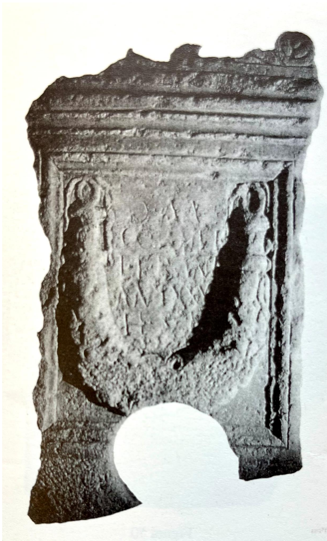
Fig. 1. Imagen de la scheda de F. X. Delgado. Biblioteca de la Universidad de Sevilla. Colección Antonio Delgado y Hernández . Legajo 2. Epigrafía: copia de inscripciones halladas en diferentes lugares de España , sign. 332/166, f. 58.