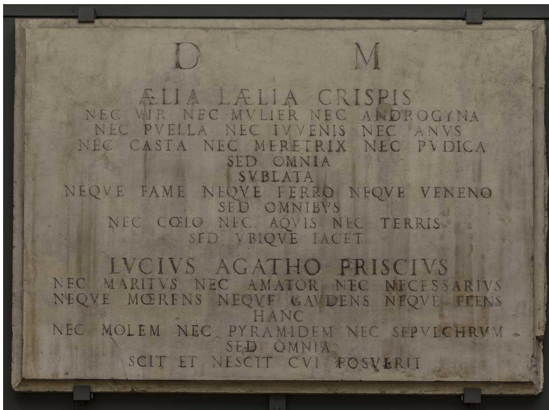
Fig. 1: Lápida Aelia Laelia Crispis . Bologna, Museo Cívico Medieval (Storia e Memoria di Bologna, en línea).