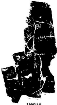
13663 乙 H.J. 13663