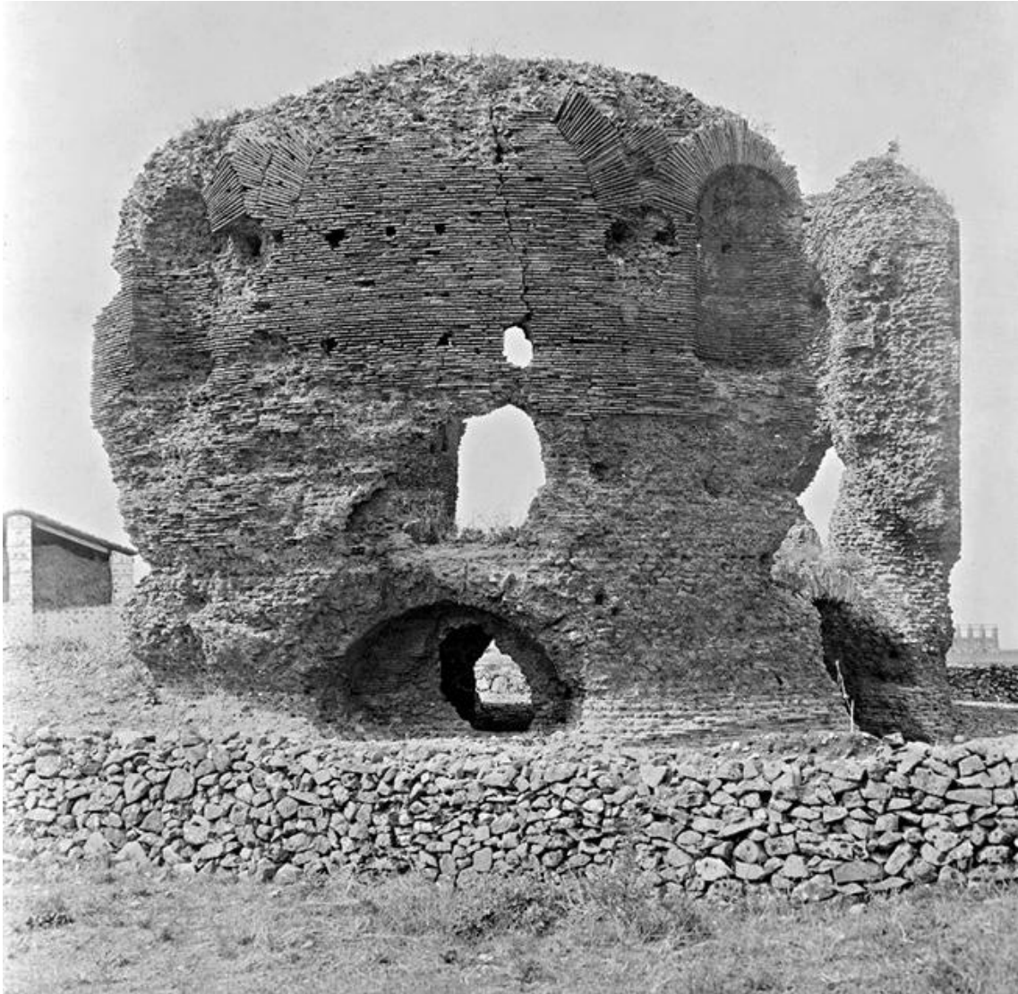
Fig 3. Restos arqueológicos del Mausoleo de Galieno en la 9ª milla de la Vía Apia, antes de su restauración (Corbascio, 2017: 36).