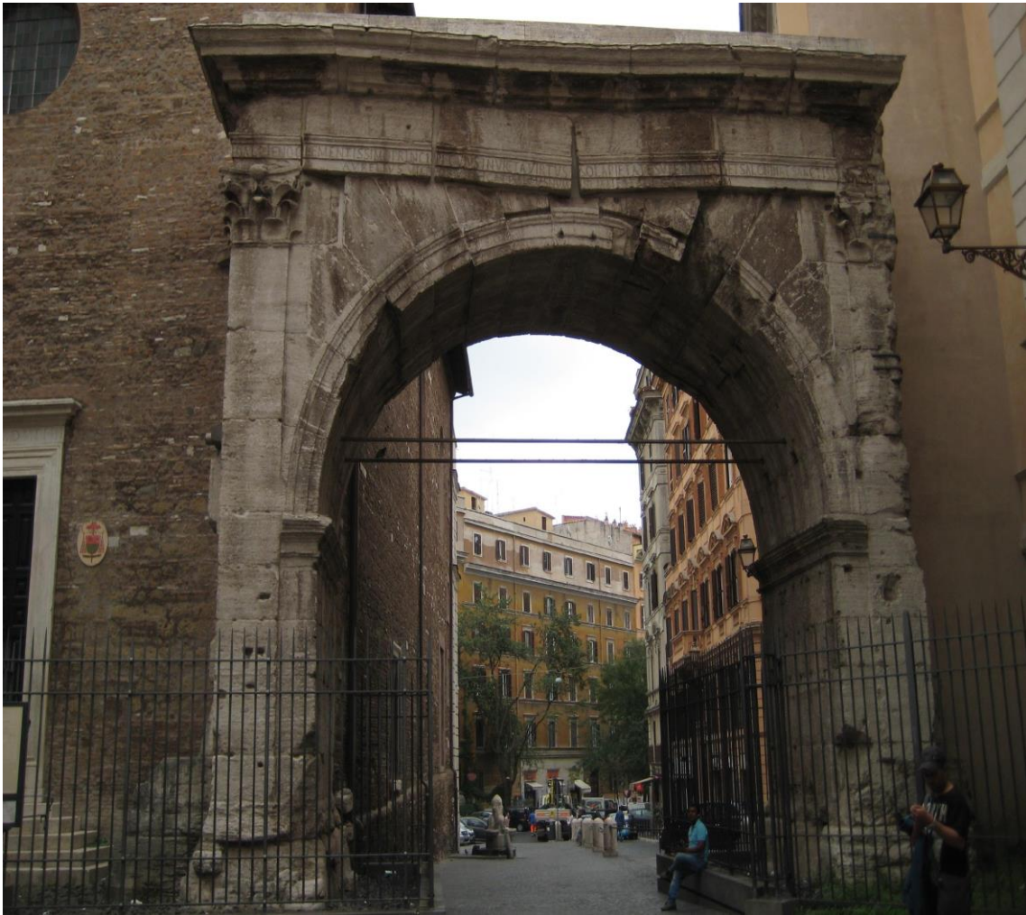
Fig 1. Puerta Esquilina, también conocida como Arcus Gallieni.