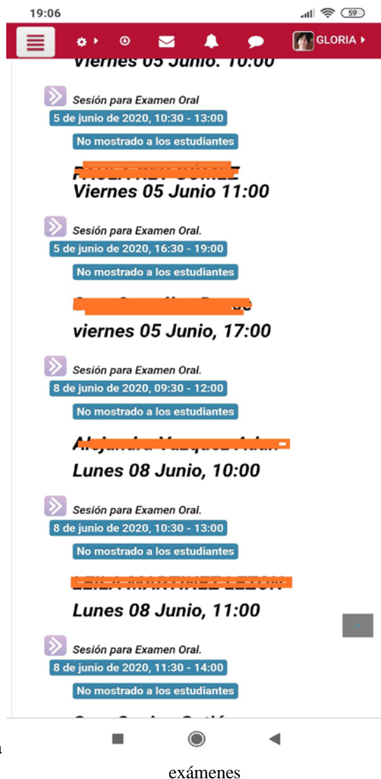
Figura 3: Videoconferencias para