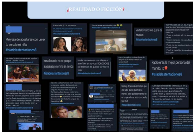
Figura 1: Corpus recopilado por una alumna para la práctica.

Al ver este corpus de mensajes, el alumnado se da cuenta de la importancia del lenguaje multimodal que se genera en las redes sociales, donde se emplea vídeos, memes, imágenes... para describir la realidad.