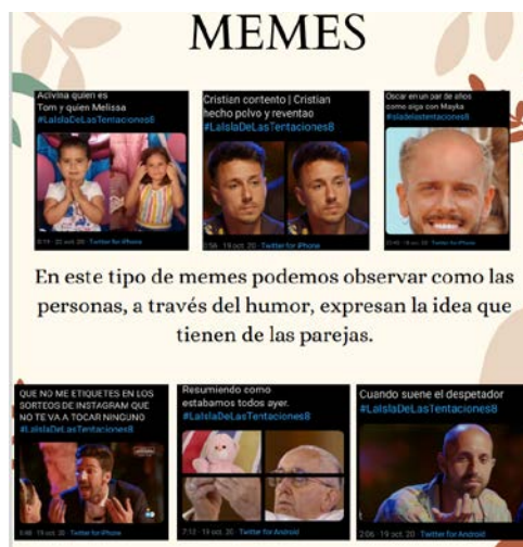
Figura 2: Memes recopilados por una alumna para la práctica. Fuente: trabajo realizado por una alumna

Al ver este corpus de mensajes, el alumnado se da cuenta de la importancia del lenguaje multimodal que se genera en las redes sociales, donde se emplea vídeos, memes, imágenes... para describir la realidad.