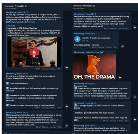
Figura 2. Canal de Telegram.

A esto se añade un canal en la aplicación móvil de mensajería instantánea Telegram, que sirve como guía para navegar por el espacio virtual de Moodle y como lugar de contacto permanente. En Telegram se informa de las pautas que van a guiar el trabajo semanal (Figura 2) a través de una narrativa que componen los mensajes escritos mediante caracteres y emojis, los documentos adjuntos y la ironía de los GIFs. De este modo, cada estudiante recibe en su teléfono móvil al principio de la semana un aviso en donde se le indican cuáles son las lecturas marcadas y dónde se encuentran en la biblioteca de recursos en Moodle. Durante las clases presenciales, el mismo canal sirve para recibir los fragmentos a analizar en el aula. También se van remitiendo, al hilo del debate y la explicación, esquemas o enlaces que el estudiante debe explorar para completar el proceso de lectura e interpretación de la obra. Al término de la semana, a veces en el aula, otras, fuera de ella, se llevan a cabo las actividades de evaluación en los propios espacios virtualizados, sea mediante de formularios –cuando corresponde un