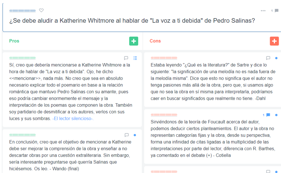
Figura 7. Ejemplo de foro de debate con Kialo.edu en la asignatura Literatura española del siglo XX (1900-1939). Fuente: elaboración propia

Kialo.edu, en cambio, se empleó para reflexionar sobre un tema siempre controvertido en Pedro Salinas: