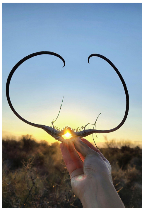
La Colonia Montecaseros, Mendoza, Argentina.

Ya olvidé lo que era la incomodidad, el algoritmo me la robó del recuerdo.