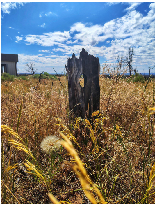
Finca La Lilia, La Colonia Montecaseros, Mendoza, Argentina.