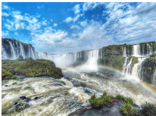
Cataratas de Iguazú, Misiones, Argentina.

Nos guiarán de regreso a la fuente cuando estemos perdidos.