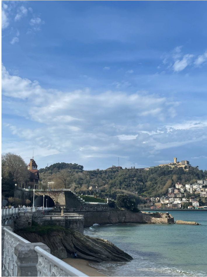
Vista de la Bahía de la Concha. Rotulador calibrado sobre papel.