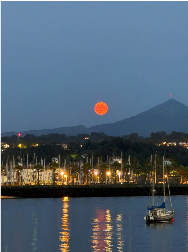
Veleros desde el puerto de Fuenterrabía. Rotulador calibrado sobre papel.