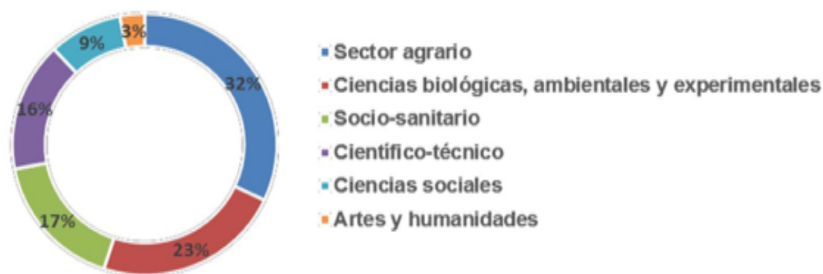
Figura 1: Perfiles profesionales de los participantes en las jornadas en porcentaje

En cuanto a las motivaciones de los asistentes para participar en las jornadas destacaron cuatro (Figura 2): (1) Formación, ampliación de conocimientos; (2) posibles salidas laborales relacionadas con la agroecología y agricultura social inclusiva; (3) crear redes de comunicación y colaboración; (4) conocer otras iniciativas; (5) el interés por conocer aproximaciones que contribuyan a la conservación del medio ambiente. Por último, el 78% de las asistentes tenían relación previa con colectivos y/o entidades vinculados con la agroecología (58%), la inclusión social y la diversidad funcional (33%), el medio ambiente (4%), la agricultura y ganadería (3%) y la agricultura ecológica (3%).