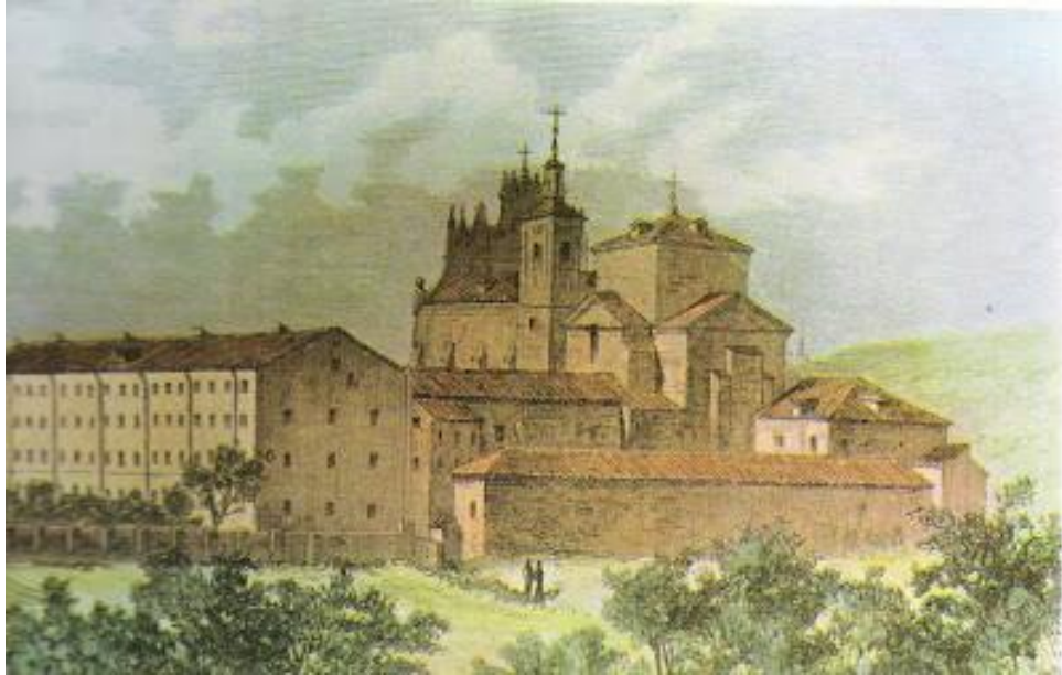
Este grabado de 1890 nos muestra al antiguo Santuario y convento.

Seguiremos caminando por la Avenida Ciudad de Barcelona y allí veremos los notables edificios administrativos de Renfe, el primero de los cuales estuvo en la primitiva estación y se trasladó aquí en 1883.