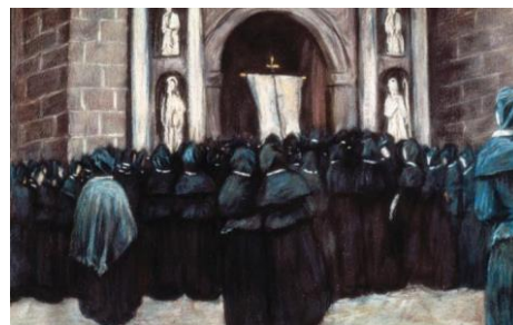
Noche de Difuntos (1886)

Recorrieron el país buscando lo oscuro y lo primitivo; perseguían lo sucio, lo abandonado, lo viejo, lo pobre, lo relacionado con la muerte y la sangre (como los toros) y las ceremonias religiosas más extrañas. Visitaron los cementerios de las zonas que visitaron; todo esto con el objetivo de encontrar inspiración para sus obras y de buscar el espíritu romántico de la España de esos tiempos para luego pintar y escribir exageraciones. Destacamos una cita que añadió al relato de su compañero belga que decía: “ España entera únicamente admite la alegría que hace sufrir ”.