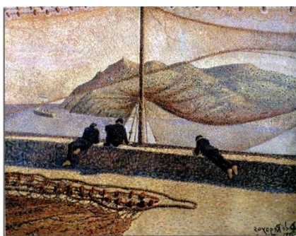
Las Redes (1893)

Gracias a su antigua amistad con Pissarro, Darío vuelve a interesarse por el paisaje y los espacios exteriores. Viaja a París y a Bruselas, estudia la obra de grandes artistas como Seurat, todo esto con el objetivo de experimentar y conocer nuevas técnicas. Aquí comienza su etapa divisionista .