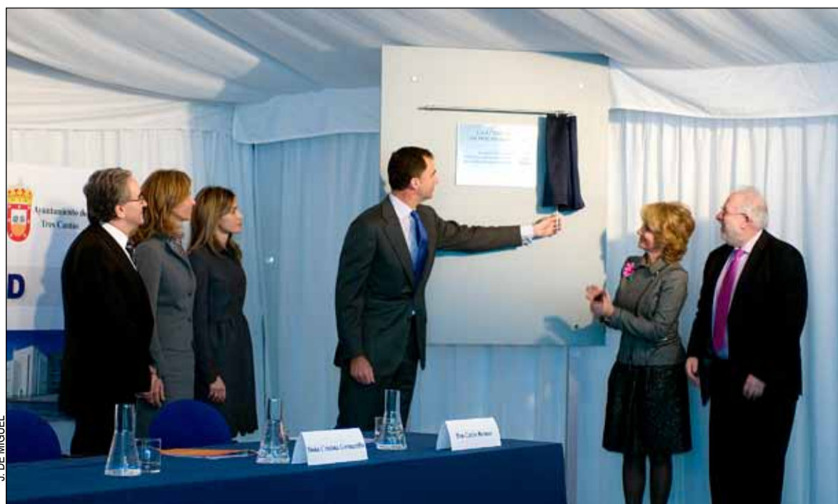
De izquierda a derecha, el rector de la UAM, la ministra de Ciencia e Innovación, los príncipes, la presidenta de la Comunidad de Madrid y el rector de la UCM

El apoyo del Gobierno se ha reflejado en los 22 millones de euros que ha aportado para la construcción del nuevo edificio.