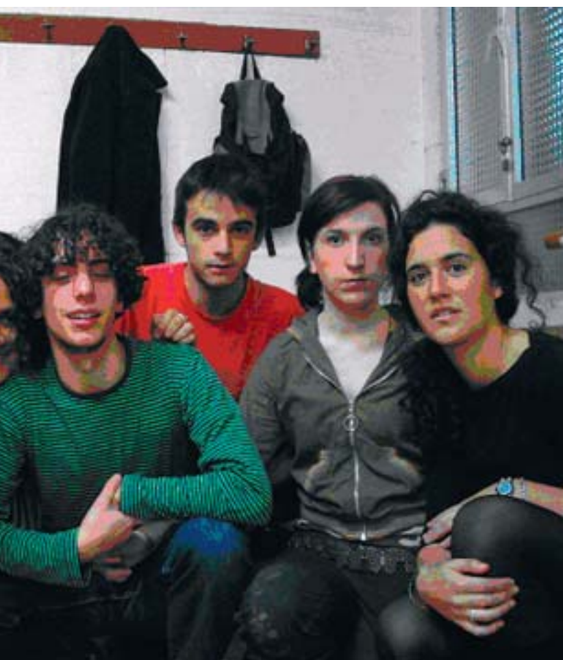
J. DE MIGUEL