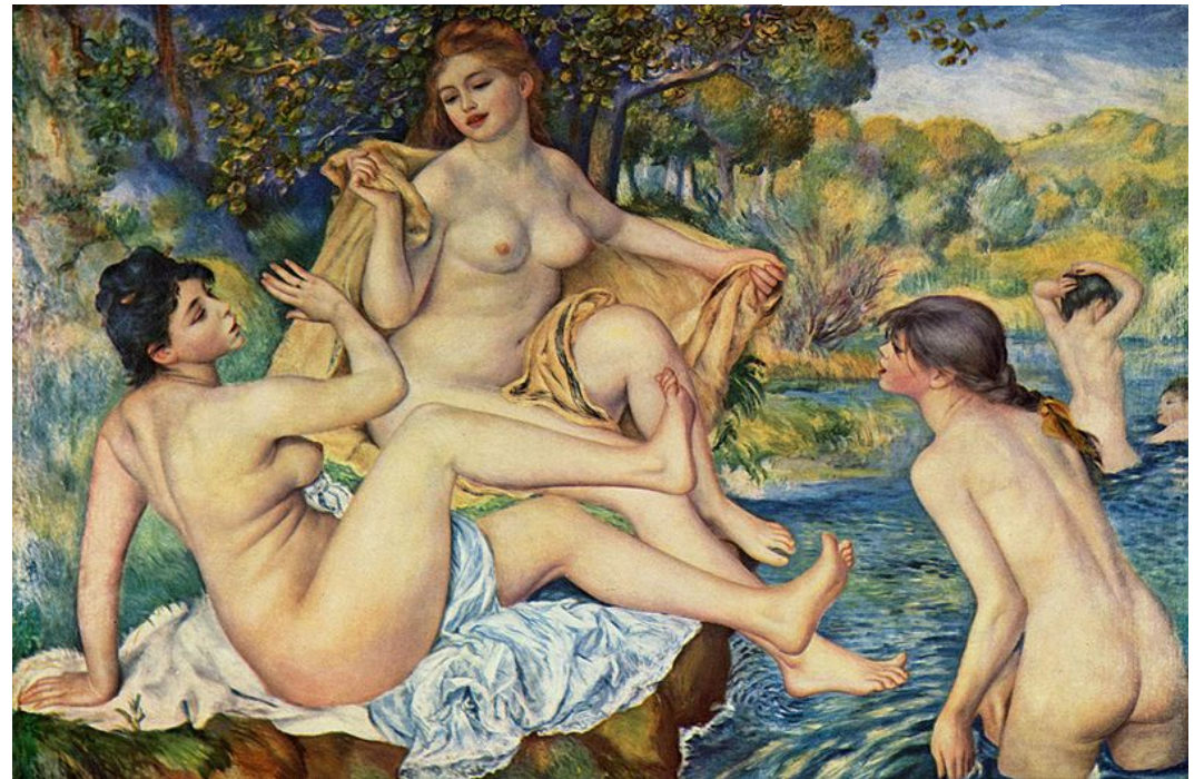
Las grandes bañistas (Les Grandes Baigneuses) Pierre-Auguste Renoir (1884-1887) Philadelphia Museum of Art, USA