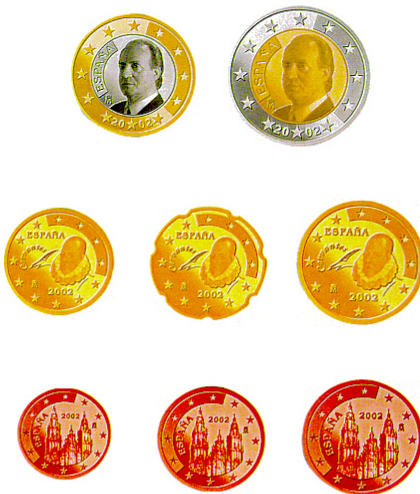
LÁMINA 9. Moneda metálica Euro: Anversos españoles.