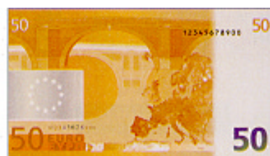
LÁMINA 11. Billetes – EURO europeos.