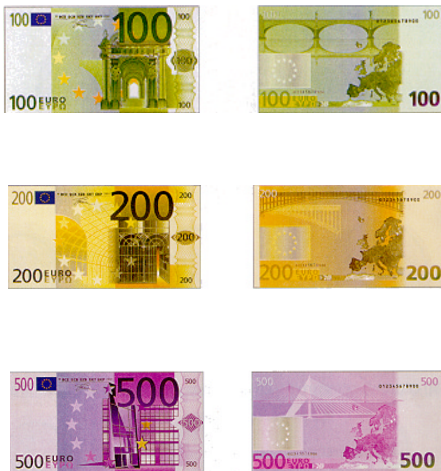
LÁMINA 12. Billetes – EURO europeos.