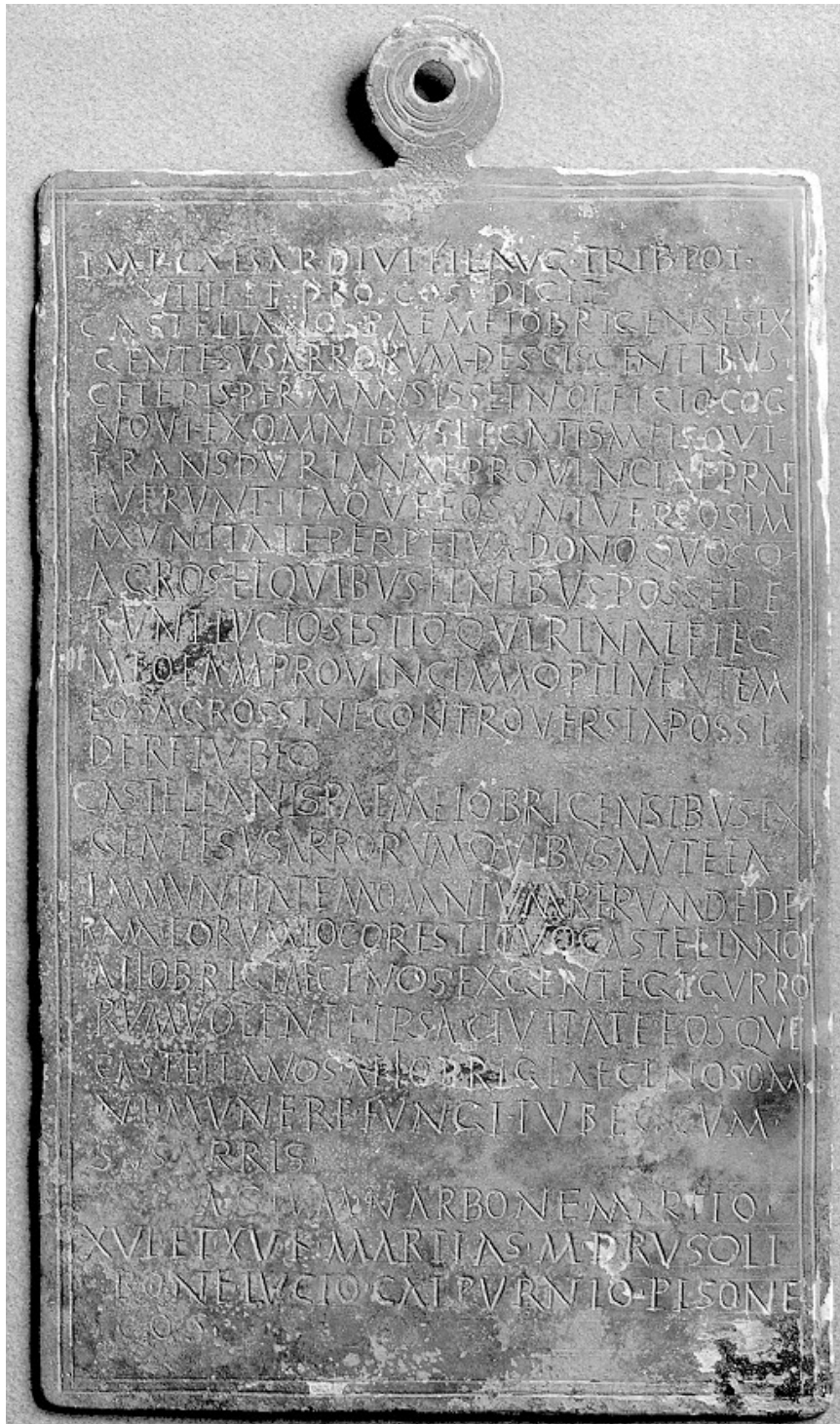
LÁMINA 4. Edicto de Augusto (año 15 a.C.).