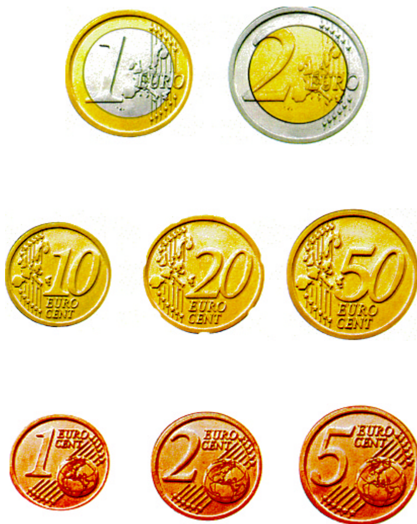
LÁMINA 10. Moneda metálica Euro: Reversos europeos.