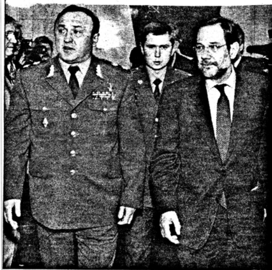
Javier Solana, acompañado por el ministro de Defensa ruso, Pavel Grachov.