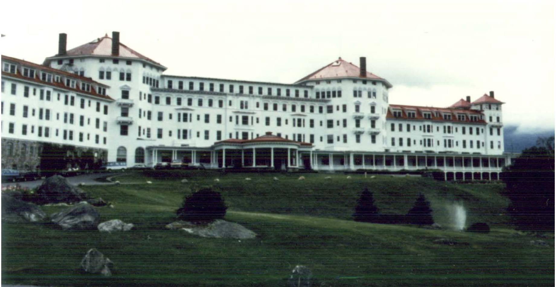
Hotel Mount Washington, en Bretton Woods, donde se realizó la Conferencia de 1944