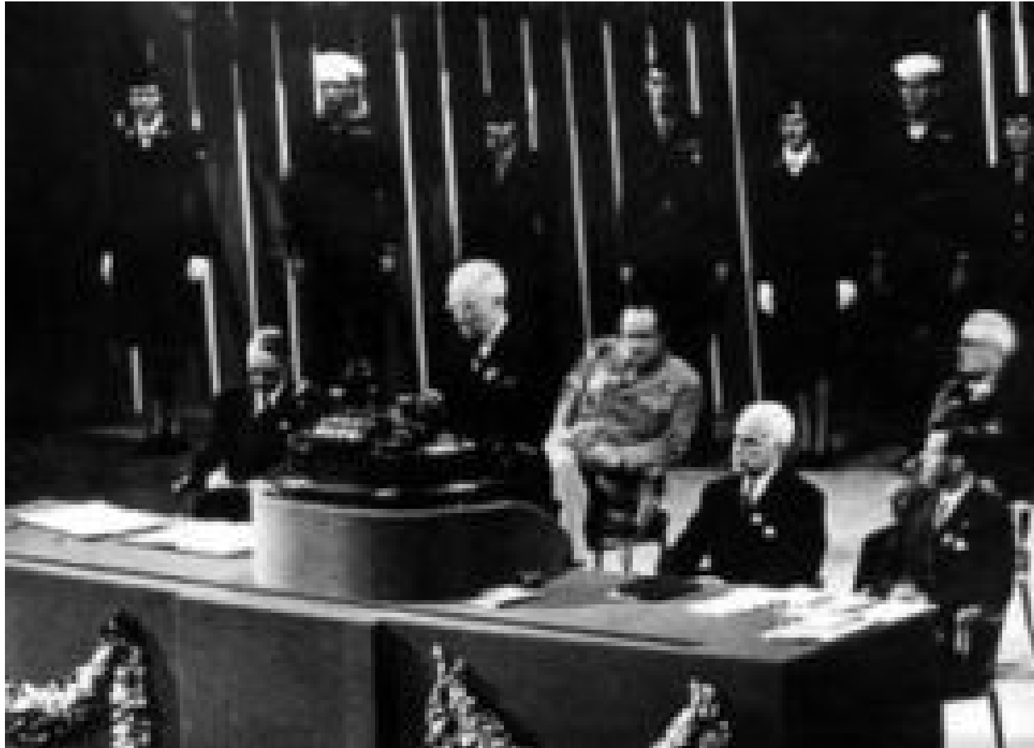
Harry Truman en la conferencia fundacional de la ONU en San Francisco, 1945.