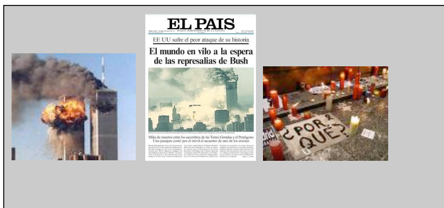
Gráfico 1. Objeto de Estudio del Proyecto de Investigación

Este proyecto de investigación es una iniciativa multidisciplinar, llevada a cabo por académicos de diferentes ámbitos de la sociología, psicología, periodismo, publicidad y relaciones públicas, política, filosofía, etc., que se reúnen con el objetivo de intentar aunar esfuerzos y ofrecer una explicación científica de la dimensión comunicativa del fenómeno terrorista. Las líneas de investigación que se están desarrollando en el proyecto se centran en tres actores: políticos, medios de comunicación y ciudadanía