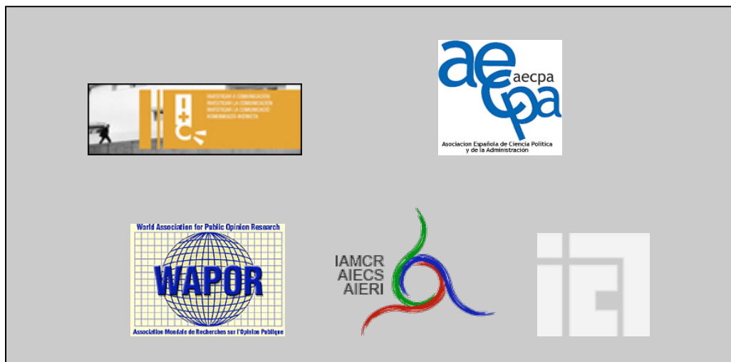
Gráfico 2. Algunos de los principales congresos en los que se han presentado comunicaciones

En España se han presentado, aún si cabe, comunicaciones en más congresos. Tal es el caso de Sevilla (2005) , Segovia (2006) , AECPA 2007 (Valencia), AE-IC 2008 (Santiago de Compostela), ACOP 2008 (Madrid) por citar algunos.