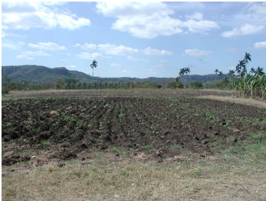
Figura 3. El sitio arqueológico. Entre sus tierras se hallan gran cantidad de evidencias que afloran producto del arado.

Por su parte Ontañón (1996) señala que el desarrollo tecnológico es una plasmación de las relaciones sociales y económicas, dentro de la concepción materialista de que los objetos arqueológicos tienen implícita una relación mas o menos directa con la sociedad que los confeccionó, de donde se deduce que esta puede ser estudiada a través del análisis de aquellos, cuyos cambios reflejan asimismo transformaciones mas profundas de orden socioeconómico. Con respecto a esto Engels (1961) plantea que la habilidad en la producción de los medios de existencia es lo mas a propósito para establecer el grado de superioridad y de dominio de la naturaleza conseguido por la humanidad.