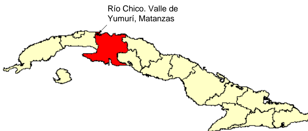
Figura 1. Ubicación de Río Chico en el Valle de Yumurí, Matanzas, Cuba.

A propósito de la polémica existente en cuanto a las comunidades en cuestión, se trazaron objetivos para tratar la complejidad de las actividades agrícolas de las mismas en un asentamiento enclavado en las inmediaciones del valle de Yumurí, aportando algunos datos de interés entorno a estos grupos.