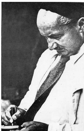
Fig 1. Martin Heidegger.

Cuando nos referimos a nuestra identidad o a la de otra persona o grupo utilizamos invariablemente el verbo "ser". Yo soy hombre o mujer, pobre o rico, señor o campesino, de izquierdas o de derechas, Ibo o Yoruba, etc. La cuestión de la identidad, sea esta abordada por la arqueología, la historia o la antropología es, por lo tanto, una cuestión acerca del ser. El análisis del ser corresponde, dentro de la filosofía, a la ontología. Así pues, cuando nos referimos a la identidad, de forma más o menos consciente estaremos tratando una cuestión ontológica. No ha de parecer baladí conocer algo de lo que los filósofos han dicho acerca del ser si nuestra intención es tratar la identidad (ahora o en el pasado) de los seres humanos.