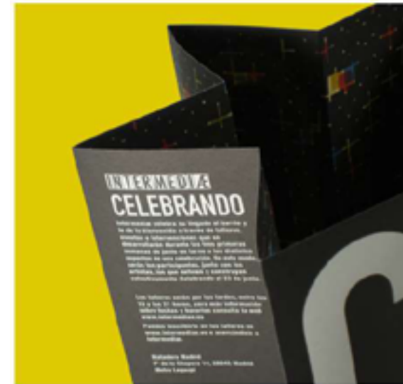
CELEBRANDO Campaña Gráfica Intermediæ / Matadero Madrid 2007