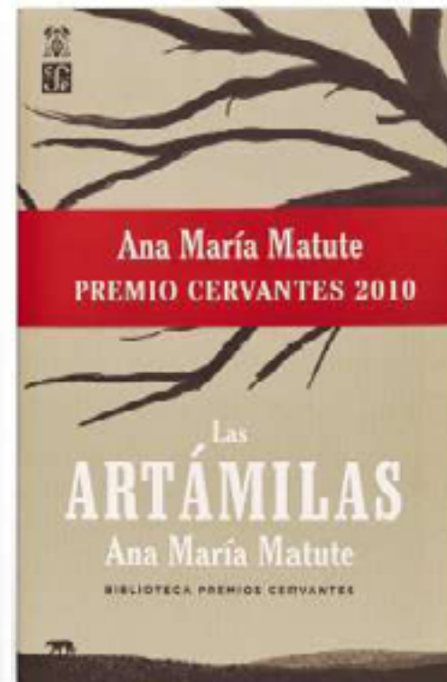
CUBIERTAS FCE Fondo de Cultura Económica