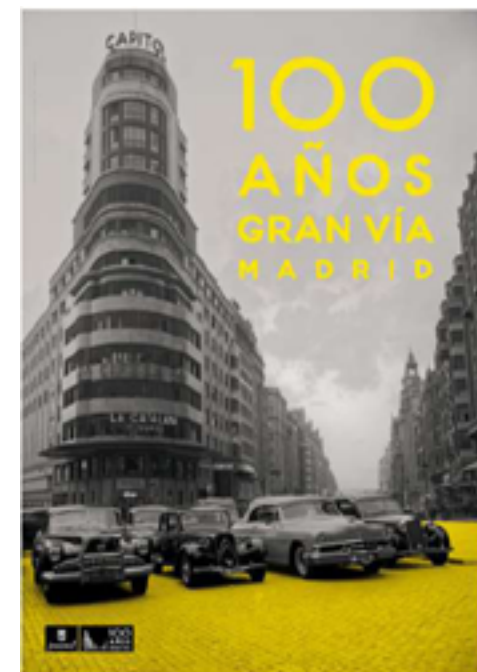
100 AÑOS GRAN VÍA Campaña Gráfica Ayuntamiento de Madrid 2009