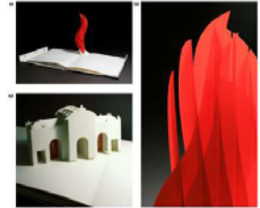
LIBRO MADRID 2012 CANDIDATE CITY Campaña Olímpica Ayuntamiento de Madrid 2005

2010 Encuentro Estudio Perricac. Jornadas de Orientación Profesional. CES Felipe II, Madrid.