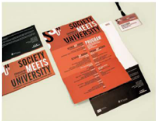
SOCIETY MEETS UNIVERSITY Congreso Universidad Autónoma de Madrid 2006