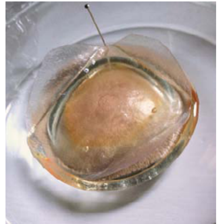
Desfloration's collection 2015 Resina, textil y cristal