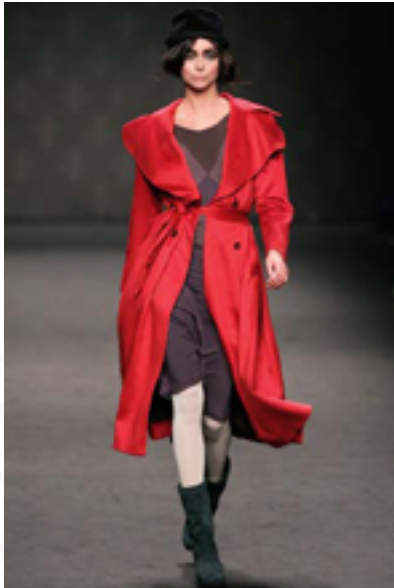
2006 diseñadora para la Colección y el desfile para Romeo Gigli, Semana de la Moda de Milán. Italia