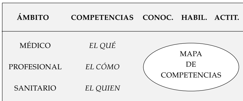
FIGURA 3 COMPONENTES Y ÁMBITO DE LAS COMPETENCIAS MÉDICAS