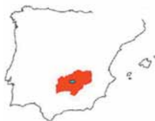
Mapa del territorio del pueblo ibero de los oretanos, donde se incluye el pequeño área de distribución de la nueva especie.

Ha resultado decisiva para la descripción de la nueva especie la aplicación de estudios moleculares. Gracias a estas técnicas, se ha podido comprobar que la especie se distingue por la presencia de un alelo diagnóstico, y por las distintas proporciones en las fre-