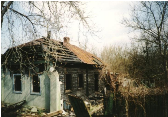
Casa abandonada en los alrededores de la central de Chernóbil.

Los efectos del accidente de Chernóbil en la salud de los trabajadores que intervinieron en las tareas de emergencia y en la población en general son objeto de gran controversia aún hoy en día. Doscientas personas fueron hospitalizadas inmediatamente, de las cuales, en pocas semanas, murieron 28 por las radiaciones y otras tres por otras causas. La mayoría eran bomberos y personal que trabajaba para controlar el incendio, ninguno con equipo de protección.