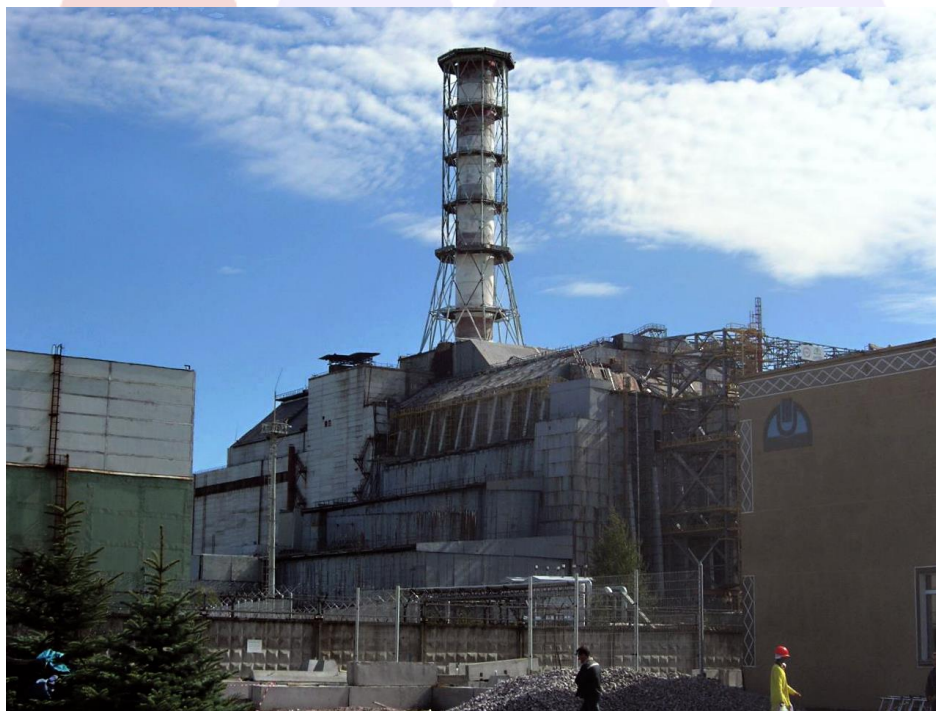
Estructura de hormigón denominada “sarcófago”, diseñada para contener el material radiactivo del núcleo del reactor de Chernóbil.

Puede parecer paradójico, pero la mayoría de los diseños de reactores nucleares que existen precisan del suministro de electricidad externo que mantenga en funcionamiento la sala de control y las grandes bombas hidráulicas que hacen circular el agua con la que se extrae el calor que genera el reactor. Y, aunque en funcionamiento normal se utilice la electricidad generada por el propio reactor, cuando este se apaga, es imprescindible el suministro externo.