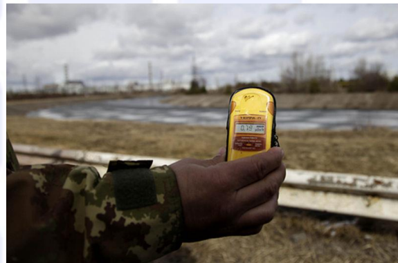
Treinta años después, la radiactividad en la zona sigue superando los niveles permitidos.

El accidente de Chernóbil se calificó también de nivel 7, pero las consecuencias fueron mucho más devastadoras que las de Fukushima porque el diseño del reactor era diferente. En este caso, el accidente no fue producido por un desastre natural, sino por fallos humanos de extrema gravedad, entre los que hay que mencionar deficiencias muy serias en el diseño de los reactores de Chernóbil, cuya puesta en marcha nunca se habría autorizado con los estándares europeos o americanos.