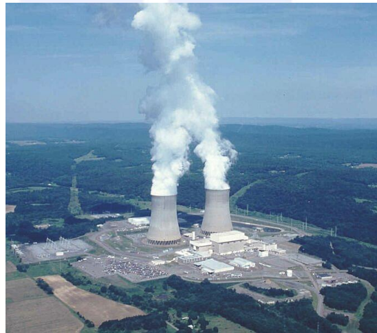
Planta de energía nuclear en Susquehanna (EEUU).

La energía nuclear es una alternativa realista para la producción estable de electricidad, que funciona de día y de noche y no depende de los vientos. No produce emisión de gases de efecto invernadero y puede constituir una gran herramienta en la lucha contra el cambio climático. No podemos permitirnos el lujo de cerrarnos a la opción nuclear sin antes un serio debate y estudio. Las centrales nucleares son hoy más seguras que antes de Chernóbil y representan una de las formas más seguras de producir electricidad a gran escala y, aunque sin duda hay que mantener la vigilancia y aumentar las medidas de seguridad si es preciso, debemos huir de miedos irracionales y comparar seriamente los riesgos de las diferentes fuentes de energía.