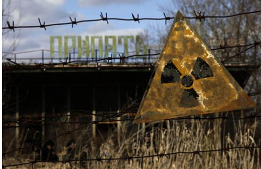
Cartel que alerta del peligro de radiación en Pripyat.

Unidad de Información Científica y Divulgación de la Investigación