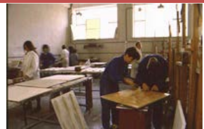
Restauración en la Facultad de Bellas Artes.

Esta nueva estructura de soporte presenta una gran facilidad para su manipulación , siendo muy adecuado para la fabricación de piezas, tanto planas como tridimensionales, en las que no se requiera una rigidez elevada.