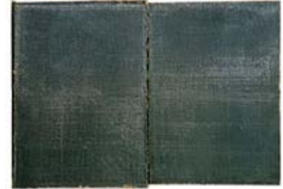
Muestra del nuevo soporte pictórico.

La presente invención se refiere a un nuevo soporte para aplicaciones de traslados en restauración de pintura mural que necesiten flexibilidad y para la realización de obras pictóricas y escultóricas, basado en una lámina simple de materiales compuestos avanzados .