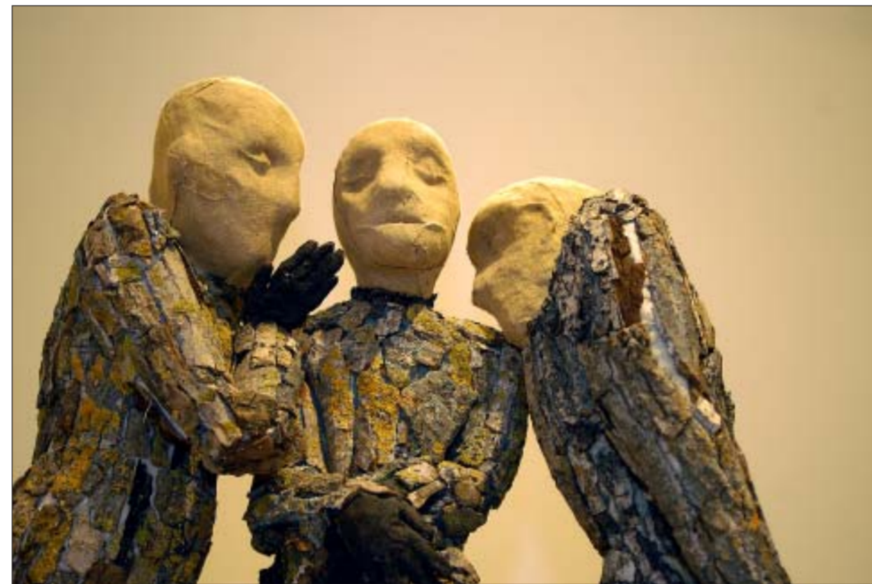
Las esculturas tienen un gran peso museístico en la exposición de becarios que se puede visitar en la Facultad de Bellas Artes

D ieciocho pintores y escultores muestran su obra más reciente hasta el día 8 de febrero