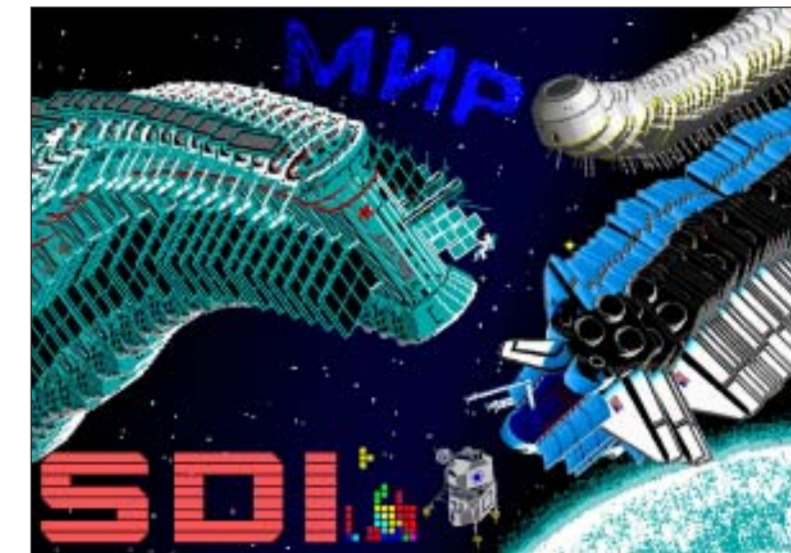
Infografía de la exposición Atari Cold War, titulada MIR

Relacionada con la iniciativa Arsgames, la Facultad de Bellas Artes acoge, hasta el próximo 7 de febrero, la exposición Atari Cold War. Según los organizadores, esta muestra quiere representar la realidad sociopolítica de occidente a finales del siglo XX a través de los videojuegos.