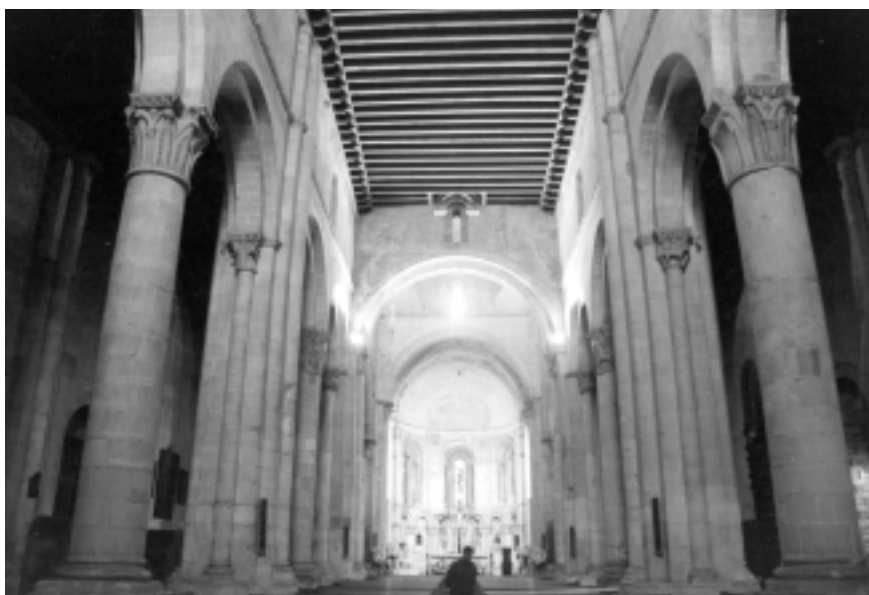
Lám. 15. Iglesia de San Millán, de Segovia. Vista de conjunto del interior fotografiado hacia el Este.