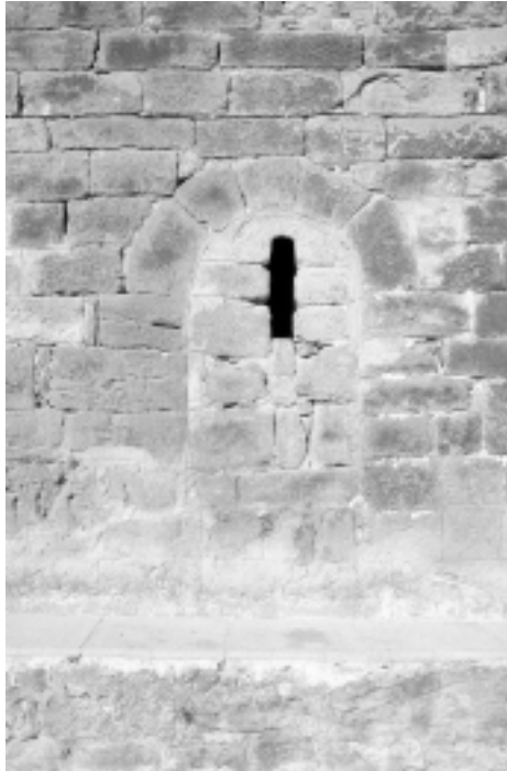
Lám. 10. Iglesia de San Nicolás de Bari, de El Frago (Zaragoza).