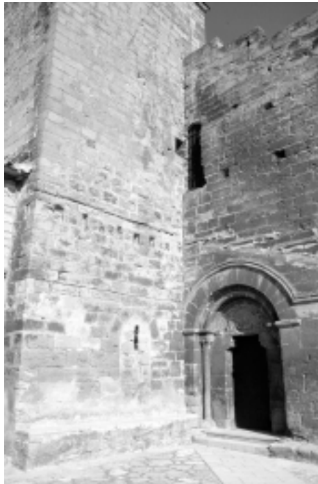
Lám. 8. Iglesia de San Nicolás de Bari, de El Frago (Zaragoza).