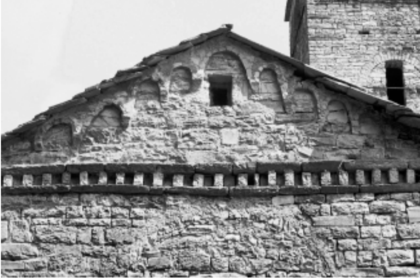
Lám. 7. Iglesia San Benedetto de la Valperlana (Lombardía). Friso de baquetones de la faz externa de la fachada fotografiado hacia el Este.