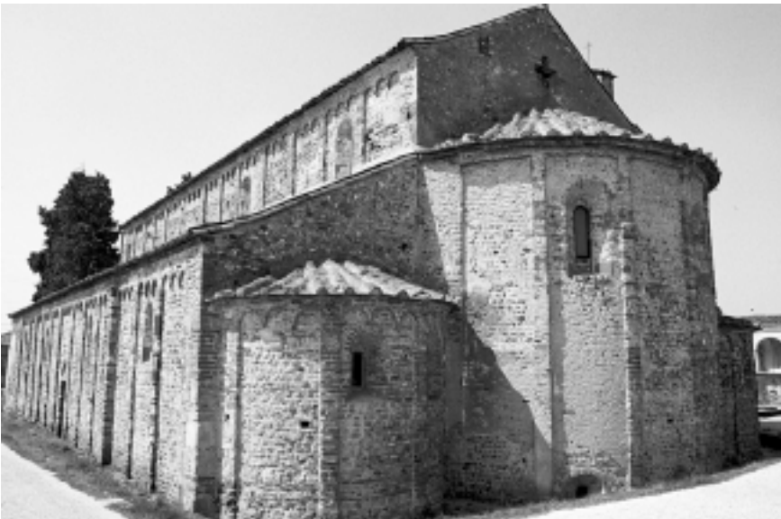
Lám. 6. Iglesia de San Michele en el cementerio de Oleggio (Piamonte, Italia). Exterior de la cabecera fotografiada hacia el Noroeste.