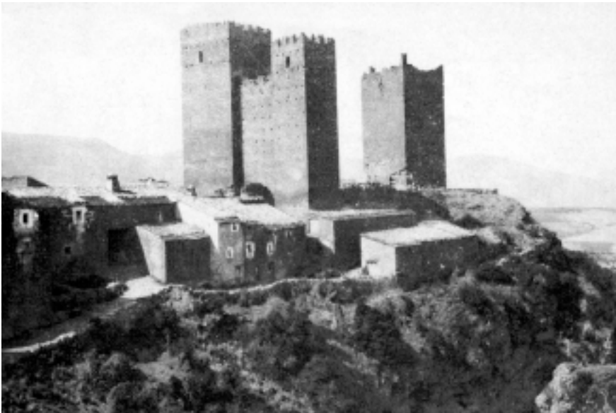
Lám. 4. Ruesta (Zaragoza). Imagen de Ruesta en 1912.