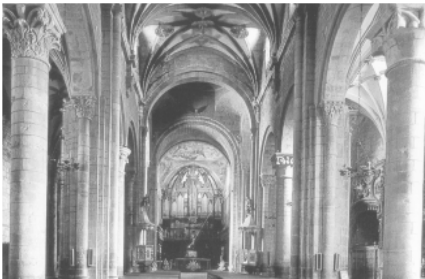
Lám. 14. Catedral de San Pedro, de Jaca (Huesca). Vista de conjunto del interior fotografiado hacia el Este en la que se aprecia cómo las esquinas triples de los pilares centrales están interrumpidas.