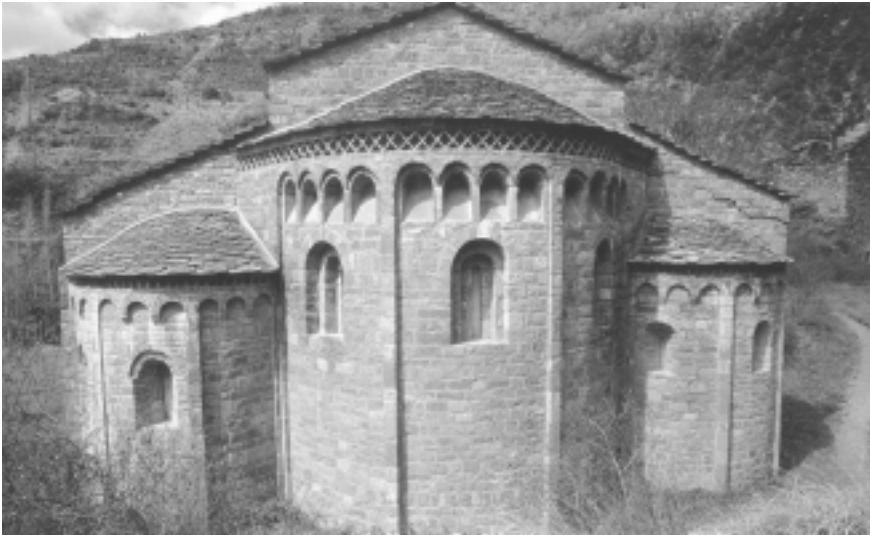
Lám. 12. Iglesia de Santa María, de Obarra (Huesca). Exterior de la cabecera fotografiada hacia el Oeste.