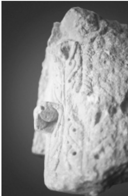
Lám. 2. Tauste (Zaragoza). Calle Marqués de Ayerbe n.º 18. Capitel islámico propiedad de don Benito Galé Zueco.