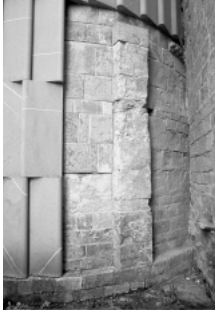
Lám. 11. Catedral de San Pedro de Jaca (Huesca). Detalle del exterior del ábside septentrional en el que se ve una lesena medial entre dos planos rehundidos concebidos para ser coronados por arquillos ciegos. Las siete primeras hiladas de sillarejo son lombardistas , mientras que las siguientes de sillaría son ya del primer arte jaqués.