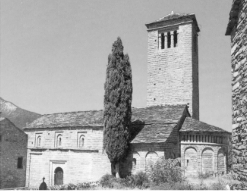
Lám. 5. Iglesia de San Pedro de Lárrede (Huesca). Exterior fotografiado hacia el Noroeste.