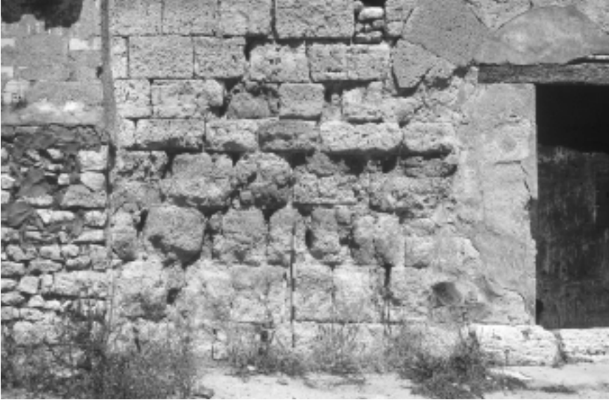
Lám. 1. La Gabardilla (Tauste, Zaragoza). Exterior del lado sureste de la torre bajomedieval, donde pueden verse las cuatro hiladas inferiores de la torre islámica del siglo X.