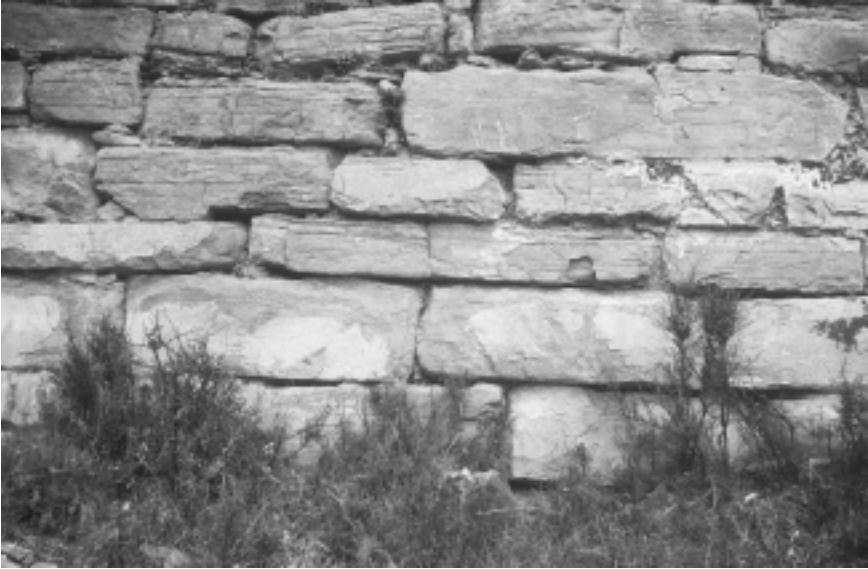
Lám. 3. Boltaña (Huesca). Castillo. Muro de cierre de la fortaleza del siglo X. Detalle del exterior del lado sur.