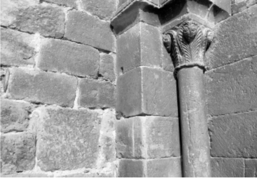
Lám. 9. Iglesia de San Nicolás de Bari, de El Frago (Zaragoza).