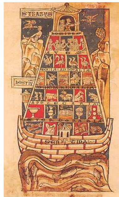
Jimenez de Rada, Rodrigo: Breviarium Historicae Catholicae. S.XIII MSS 138