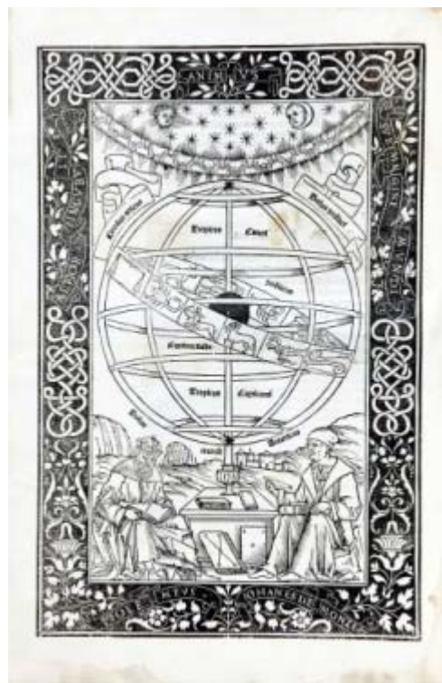
Johannes Regiomontanus Epitoma in Almagestum Ptolomaei Venetiis : Hamman : Casparis Grosch et Stephani Roemer, 31 agosto, 1496 BH INC I-29(1)